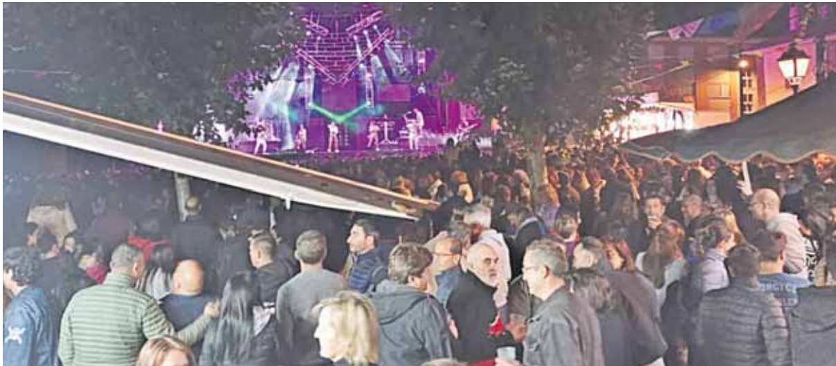
Momentos de las fiestas de San Cristóbal de Segovia en años anteriores.

EL ALCALDE DESTACA LA COLABORACIÓN DE LOS QUINTOS JUNTO A LA COMISIÓN DE FESTEJOS, GRANDES ORGANIZADORES DE LAS FIESTAS