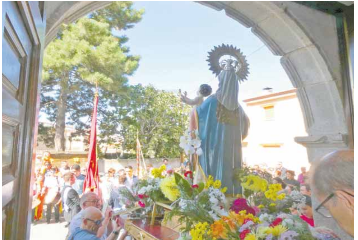
Salida de la Virgen frente a todos los fieles de la localidad.

PEÑAS, MÚSICA, VERMÚS, ALMUERZOS Y UN GRAN AMBIENTE SE ADUEÑAN YA DE LAS CALLES DEL MUNICIPIO, A LAS QUE LLEGA LA FIESTA DE MANERA INMINENTE