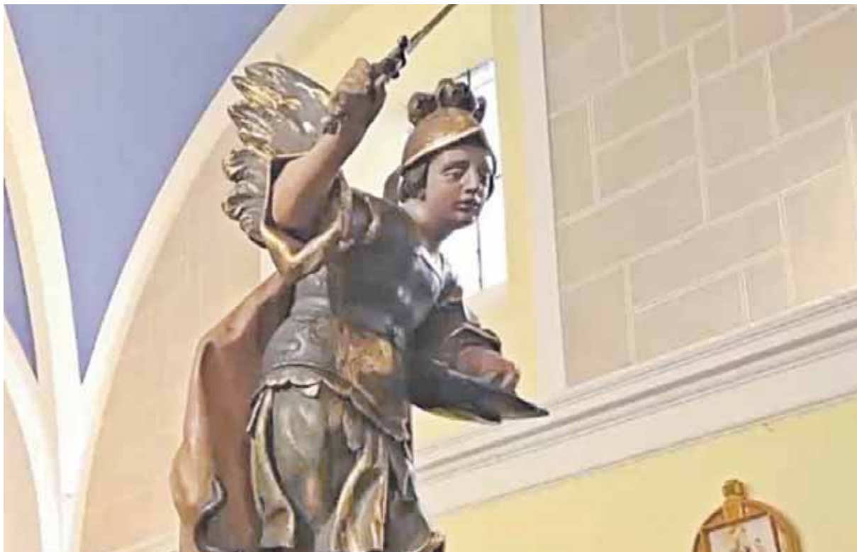
Imagen de San Miguel en la localidad de Muñopedro

LLEGAN LOS DÍAS MÁS ESPERADOS A MUÑOPEURO AÚN CON EL RECUERDO DEL VERANO Y CON MUCHAS DE GANAS DE PASARLO BIEN DURANTE CINCO DÍAS EN LOS QUE LA ACTIVIDAD ES FRENÉTICA CON ACTIVIDADES PARA TODOS LOS GUSTOS Y PÚBLICOS