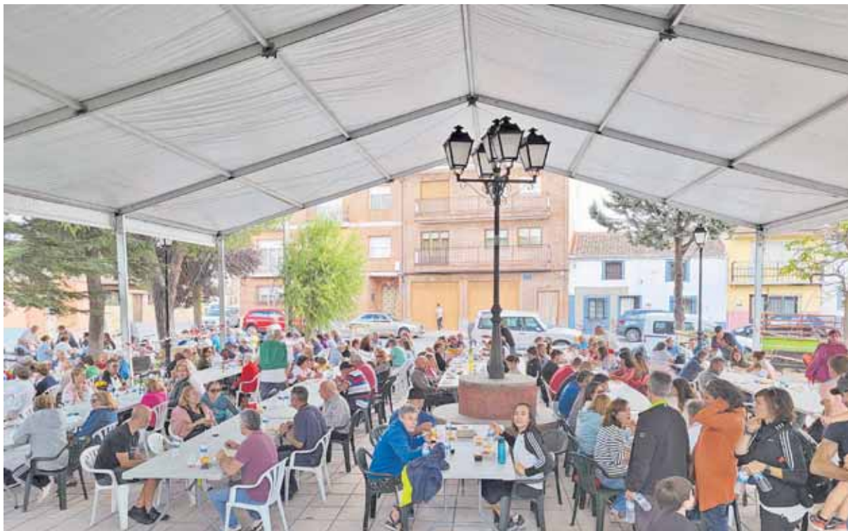
Las comidas populares en la Plaza Mayor son una de las actividades más esperadas por los vecinos.

te, tiene otras muchas necesidades que atender.