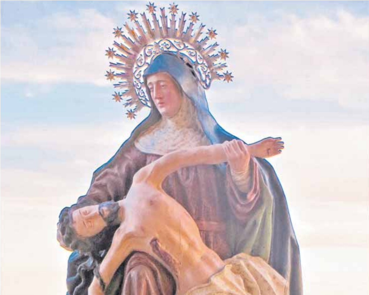
Nuestra Señora Virgen de la Piedad.

LAS FIESTAS PATRONALES EN GARCILLÁN SE ORGANIZAN EN HONOR A EXALTACIÓN DE LA SANTA CRUZ Y NUESTRA SEÑORA LA VIRGEN DE LA PIEDAD Y SE DESARROLLAN DURANTE ESTE, Y EL PRÓXIMO FIN DE SEMANA