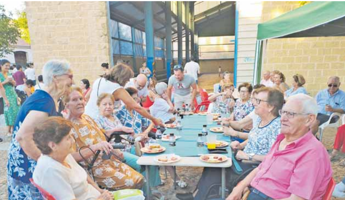
Los mayores de la localidad también participan en los eventos programados.