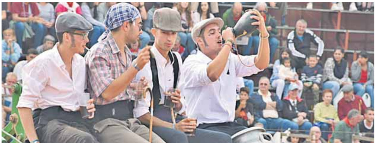
La localidad está ya inmersa en las actividades festivas de este 2023.