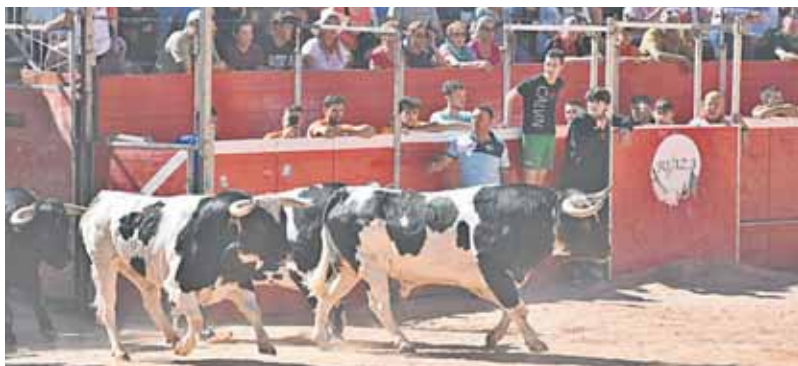
Instantes de la fiesta en años anteriores.