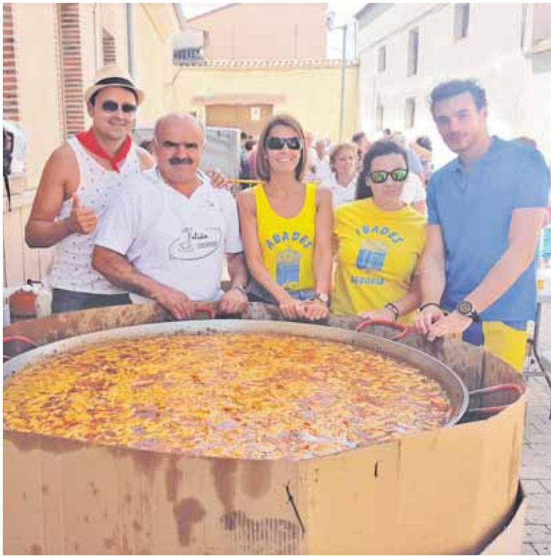
Comida popular en las fiestas de Abades.