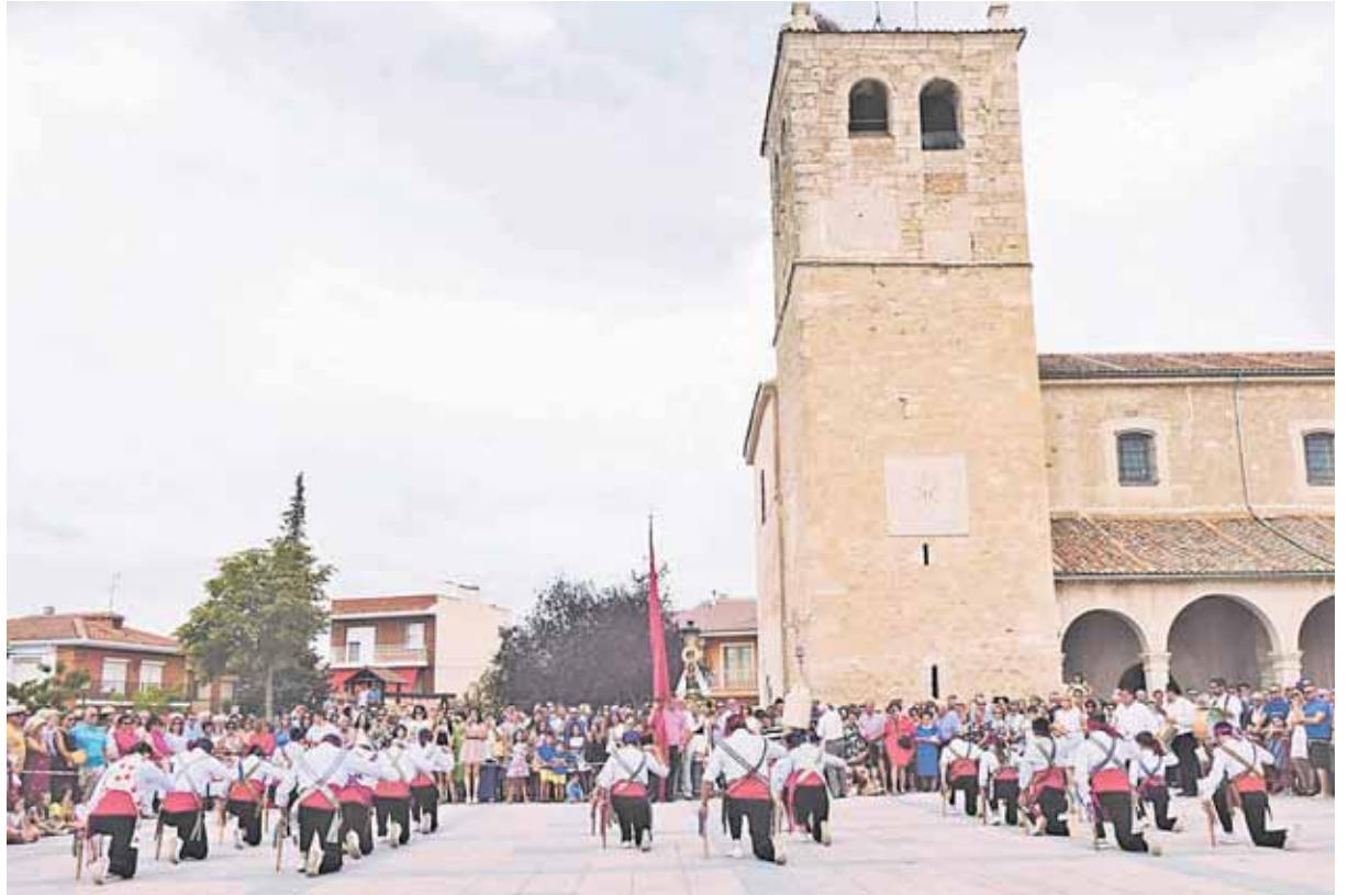
Bailes tradicionales en honor a la patrona de la localidad la Virgen de los Remedios

COMIENZAN LAS FIESTAS DE LA LOCALIDAD CON UN PROGRAMA LLENO DE ACTIVIDADES