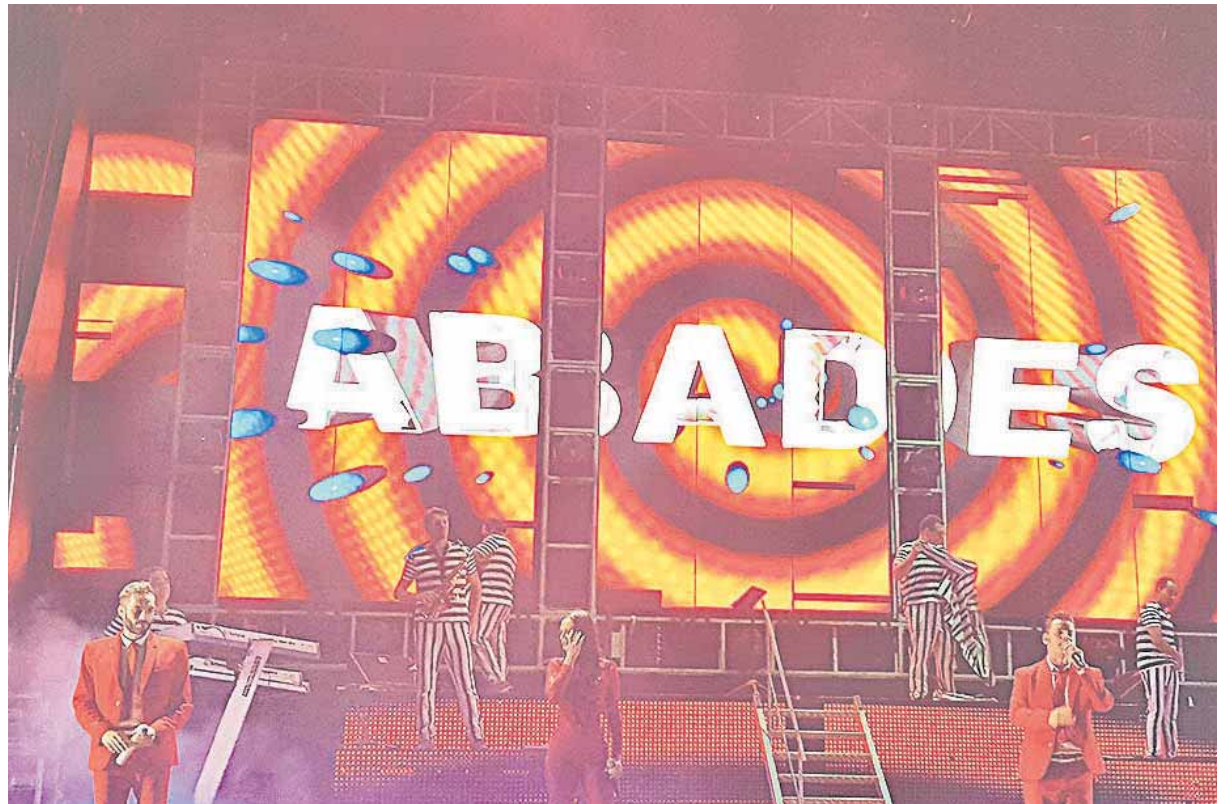
Noche musical a cargo de una orquesta en las fiestas del municipio.