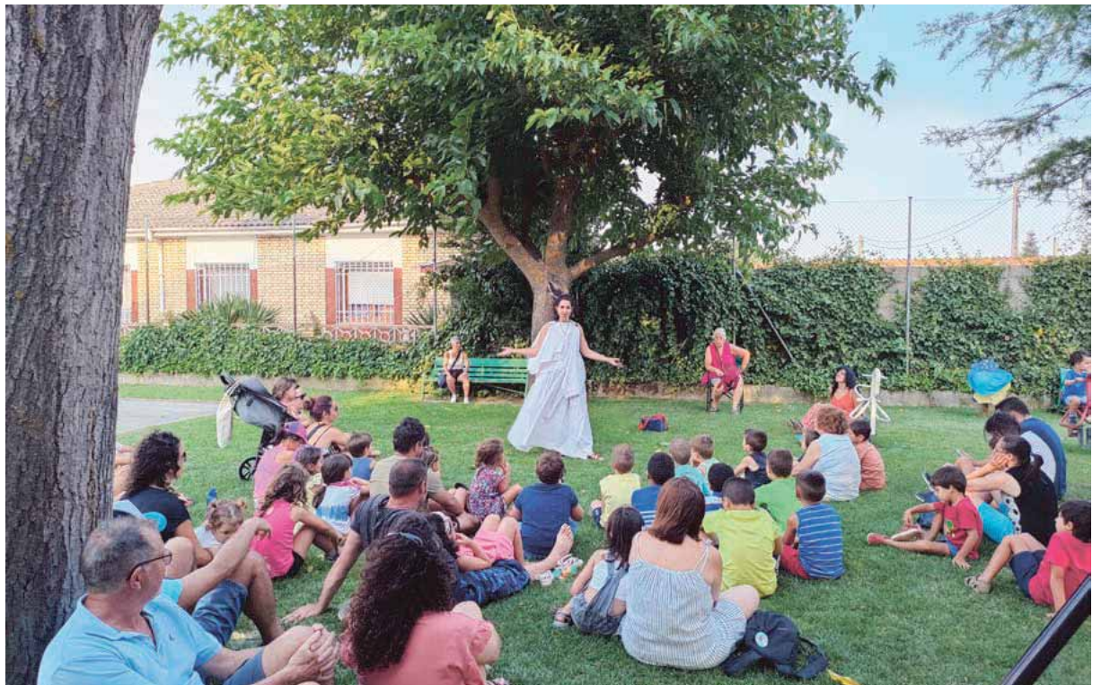
Notable asistencia de público, adulto e infantil, en el cuenta cuentos en el Parque del depósito.

LA DIVERSIÓN ESTÁ ASEGURADA EN EL MUNICIPIO SEGOVIANO DE GOMEZSERRACÍN QUE CELEBRA UN FIN DE SEMANA POR TODO LO GRANDE EN HONOR A SU QUERIDA PATRONA