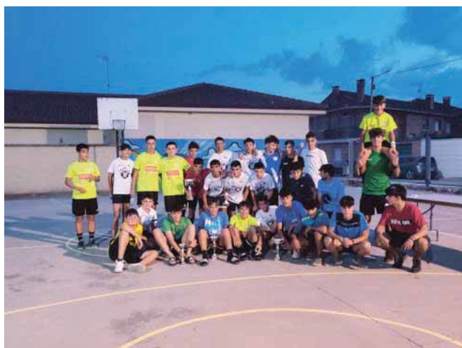
Jotas segovianas, veladas musicales, fiesta holly y torneo de fútbol sala, entre otras muchas actividades.

cargados de alegría y haciendo gala de la unión y el saber estar que siempre han demostrado”.