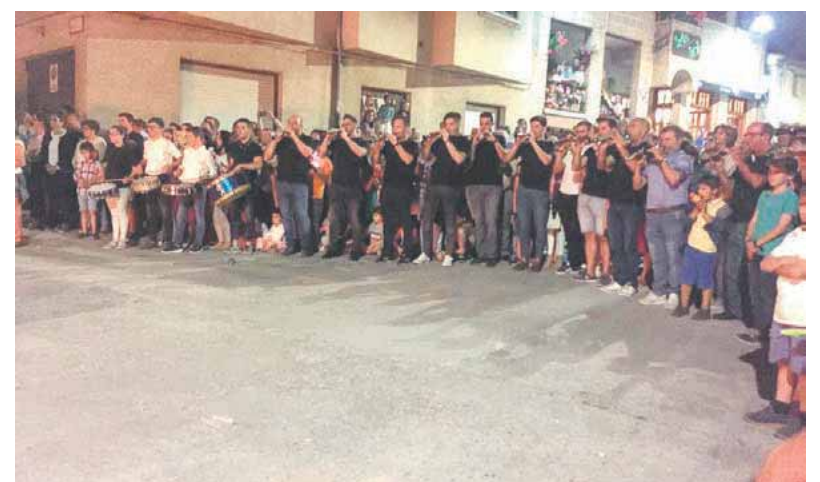
Una fiesta muy vinculada a la dulzaina y el tamboril, a las jotas y a los paloteos.

mar”, intentar olvidarnos de todo aquello que no nos gusta de nuestra vida y dar paso a nuevas esperanzas futuras. La hoguera como es tradicional se sitúa en la Plaza El Pósito Real.