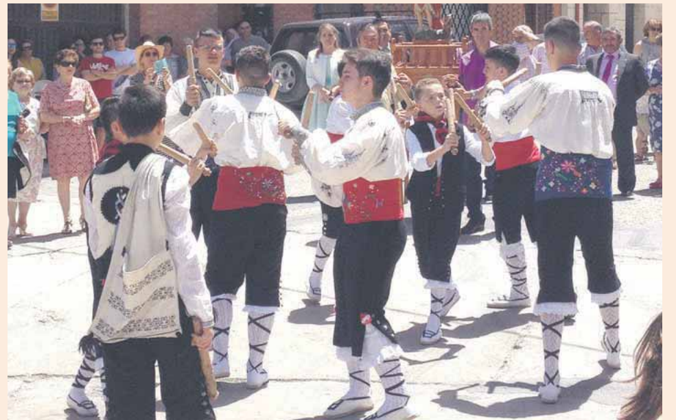
La Actuación del Grupo de Danzas y Paloteo del pueblo en la Plaza de España, de los actos más arraigados.