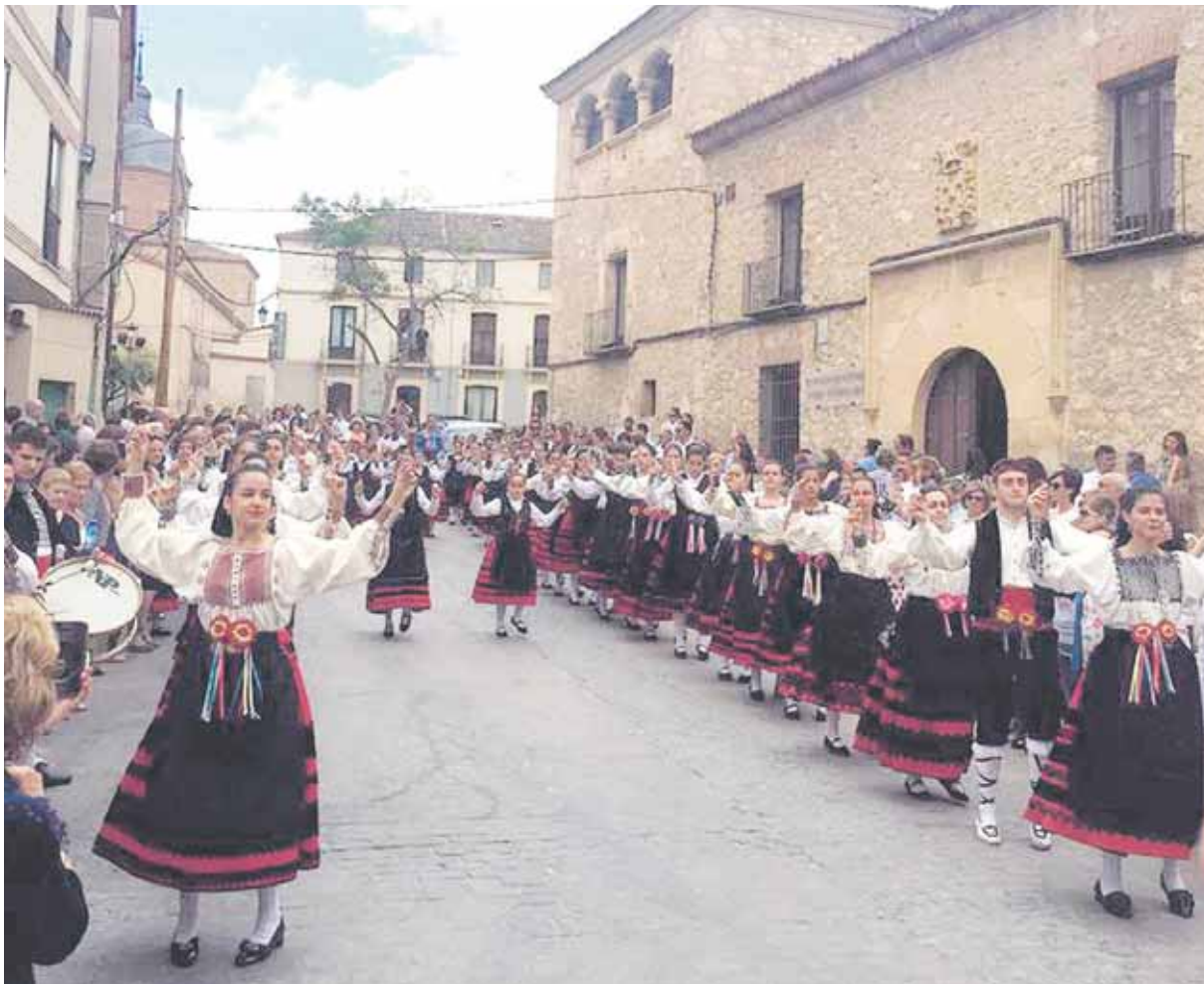
La procesión al Patrón, San Juan Bautista, es uno de los actos centrales y más emotivos de las fiestas.

a 17.00 horas la esperada comida en la ermita y ya por la tarde —a las 20.00 horas— el desencajonamiento de dos toros y una vaca. A las 21.30 horas amenizará la jornada la Charanga Ojay y la orquesta Sándalo en la plaza de Abastos la noche festiva.