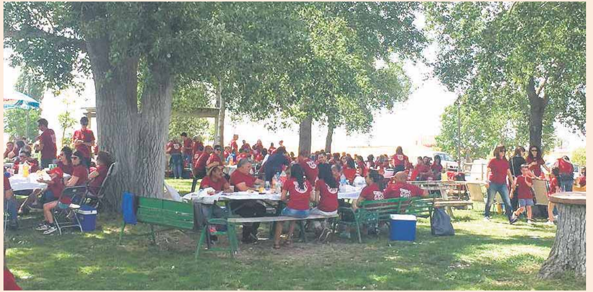
La tradicional comida en la ermita del Bustar reúne cada año a vecinos, familiares y amigos.