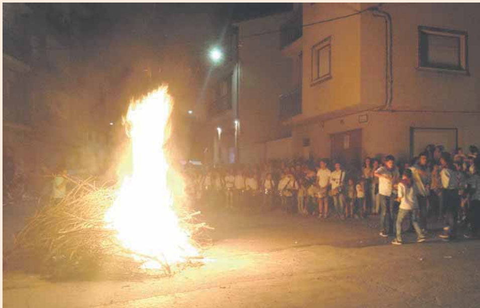
Hoguera de San Juan amenizada por la Escuela de Dulzaina y Tamboril de Carbonero el Mayor.