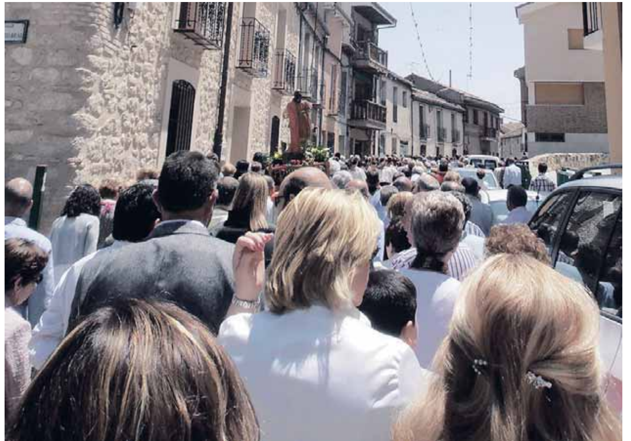
Una vez más los carbonerenses volverán a hacer gala de su implicación y participación en los actos festivos.

— Han sido momentos duros, momentos difíciles los que nos han tocado vivir, echamos en falta a gente pero, no hay mejor manera de volver a vivir nuestras tradiciones honrando a nuestra patrona, la Virgen del Bustar, hace unos días en su romería y, ahora poder