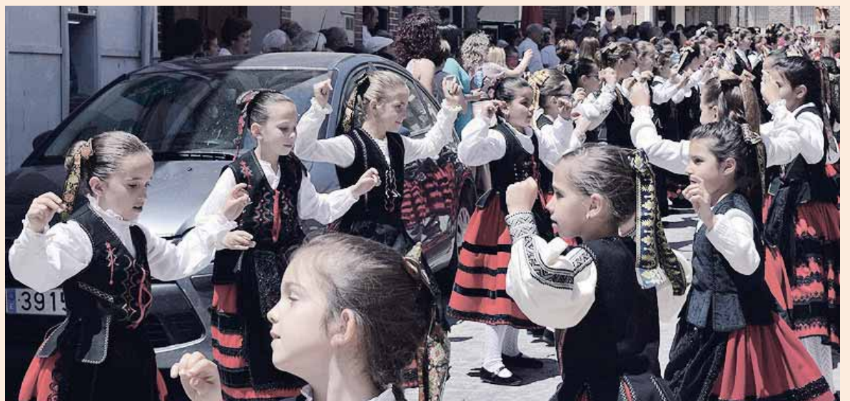
Las más jóvenes de la localidad bailan a su venerado patrón, durante la procesión por las calles del municipio.