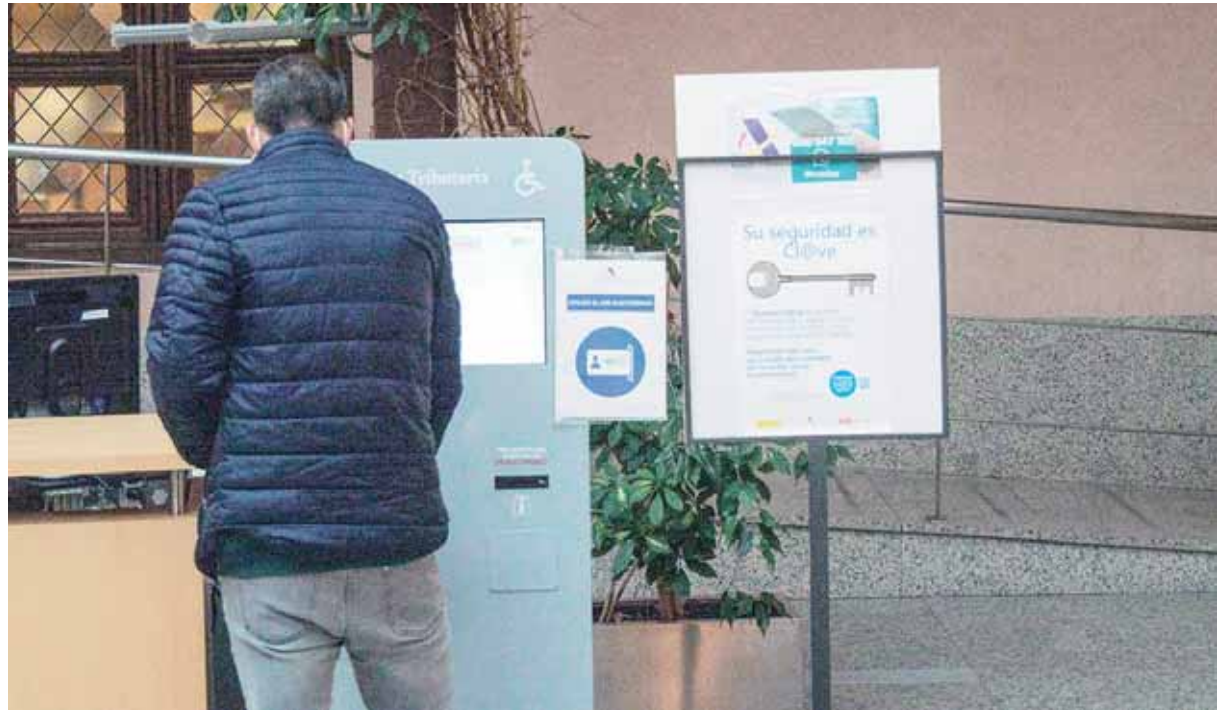
Hasta el 30 de junio se puede presentar la declaración, con diferentes plazos según el canal por el que se realice.

Los requisitos que se deben de cumplir para la aplicación de esta deducción son que el contribuyente tenga su residencia habitual en la Comunidad de Castilla y León y que tenga menos de 36 años. Que se trate de su primera vivienda habitual y que la vivienda esté situada en un municipio o en una entidad local menor de Castilla y León, que en el