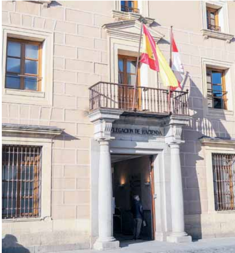
Delegación de Hacienda en Segovia.

También es importante tener en cuenta que todo contribuyente puede acceder a sus datos fiscales directamente a través del portal de la Agencia Tributaria —en concreto, en el apartado de ‘Accede Renta 2021’ donde po-