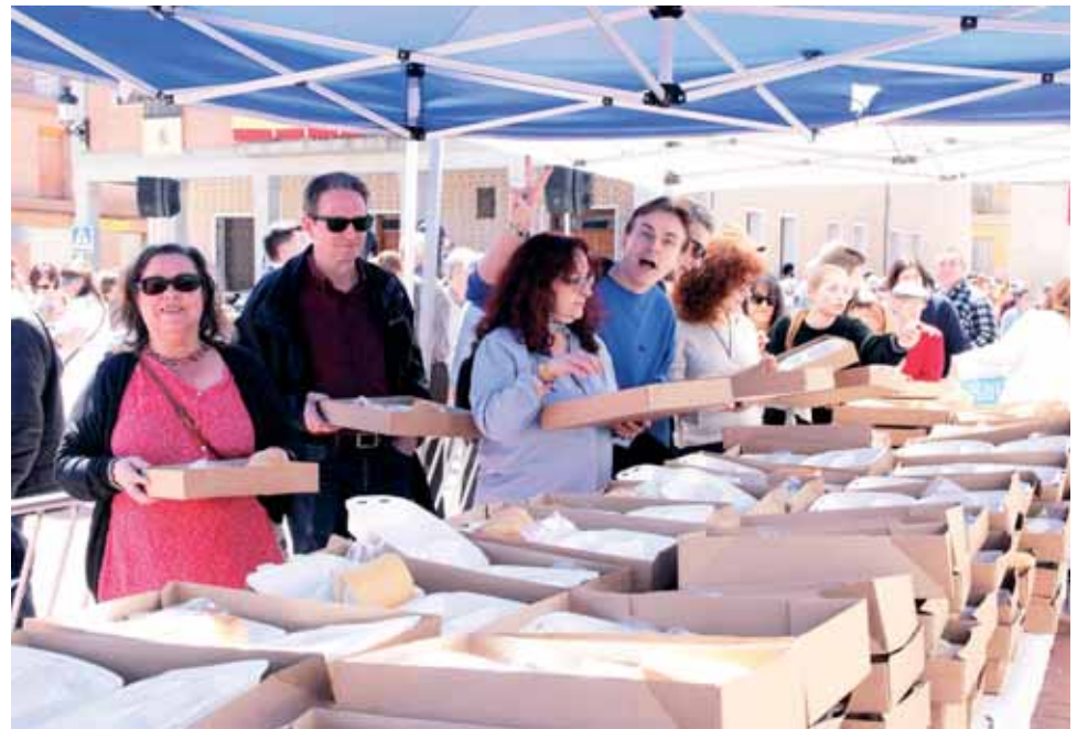
Degustación del afamado potaje con Chorizo de Cantimpalos en la Plaza del pueblo, durante la última edición de la Feria celebrada en el año 2019.