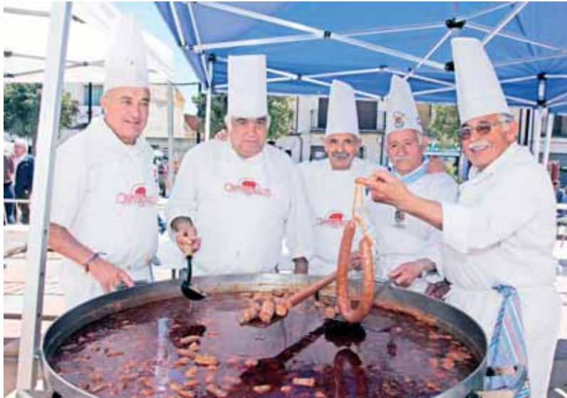
Asociación de Cocineros de Segovia que elabora el plato estrella de la feria.

A partir de las 13.30 horas habrá un concierto de la mano de Xosé Liz Cuarteto, también en la Plaza Mayor, que amenizará la jornada y a partir de las 15.00 horas se celebrará uno de los actos más esperados de la XXI edición de la Feria del Chorizo de Cantimpalos, la degustación del chorizo con garbanzos de Uty de Villovela de Pirón con Bacalao y Verduras.