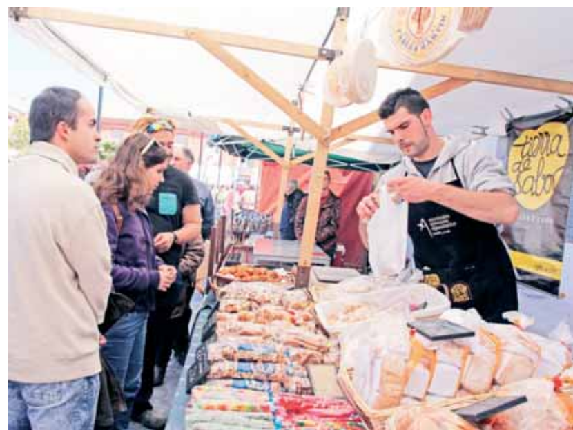
Expositores participantes en una feria anterior, muestran sus productos elaborados artesanalmente en la Plaza Mayor del pueblo y sus calles adyacentes.