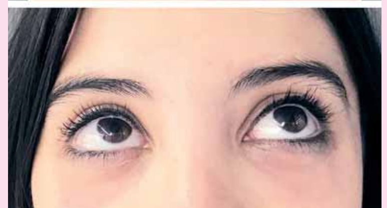
Tratamiento y relleno de ojeras, eficaz y con buenos resultados. FOTO LÁSER MÉDICA