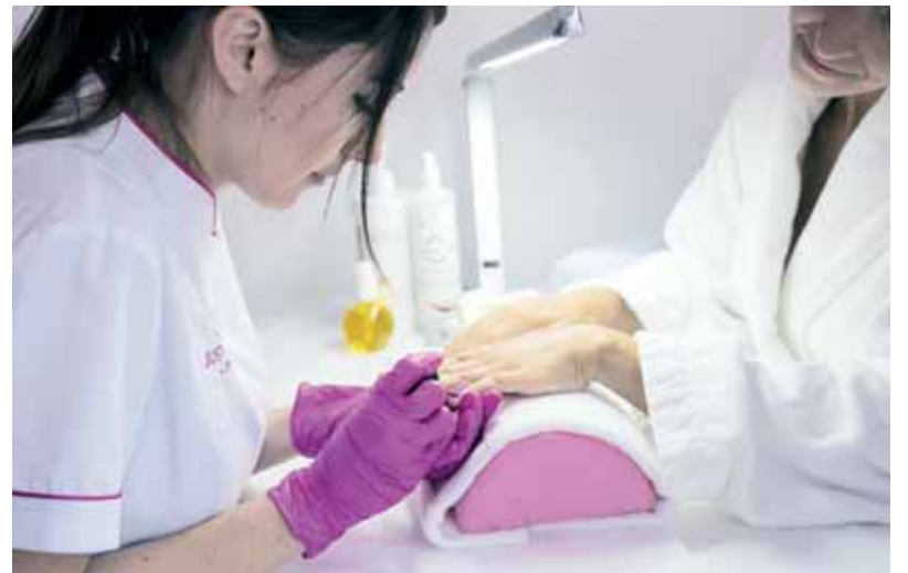
Las uñas que más se demandan son las acrílicas o de gel.

DENTRO DEL SECTOR DE LA ESTÉTICA, LA MANICURA ESTÁ EN PLENO 'BOOM' CONVIRTIÉNDOSE EN UN EMBLEMA PARA LAS MUJERES GRACIAS A CIERTAS 'CELEBRITIES' COMO ROSALÍA