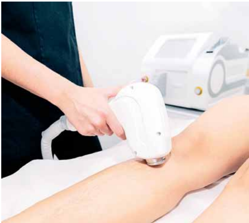
Una buena elección a la hora de decantarse por un centro de estética es esencial.

LA DEPILACIÓN LÁSER SE HA CONVERTIDO EN LA FORMA DE DEPILAR MÁS EFECTIVA Y DETERMINANTE DE CUANTAS EXISTEN EN EL MERCADO