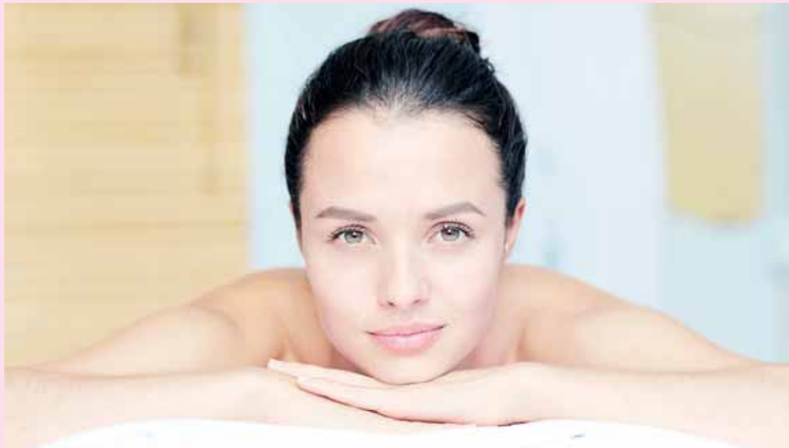
El tratamiento completo comienza en cabina y termina en casa.

Y por último, que se puede considerar la quinta fase, es el tratamiento en casa que consiste en restaurar, proteger y rehidratar la piel en siete días y siete noches. Es decir, hay que seguir regenerando y restaurando la piel durante los días posteriores a la exfoliación.