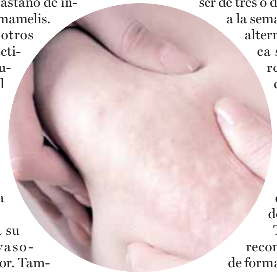
Reduce la apariencia de la celulitis

LOS PROFESIONALES DEL SECTOR RECOMIENDAN COMPLEMENTAR EL TRATAMIENTO EN CASA, CON UNA DIETA EQUILIBRADA, ACTIVIDAD FÍSICA DIARIA, COMO PASEAR ENTRE 30 Y 60 MINUTOS, Y BEBER DOS LITROS DE AGUA POR DÍA