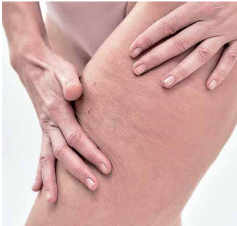
Consiste en un tratamiento eficaz en tan solo tres sencillos pasos.

Consiste en un tratamiento limpio, rápido y eficaz para la estética, que con tan sólo tres productos y sesenta minutos consigue los mejores resultados. Ya que, entre los beneficios que encuentran sus usuarios, desde la primera sesión, se pueden destacar la reducción visible de los nódulos de grasa; una mejora de la apariencia de la celulitis; la piel más firme y una mayor definición de contornos; así como una disminución del volumen corporal, además de efecto drenante y descongestionante.