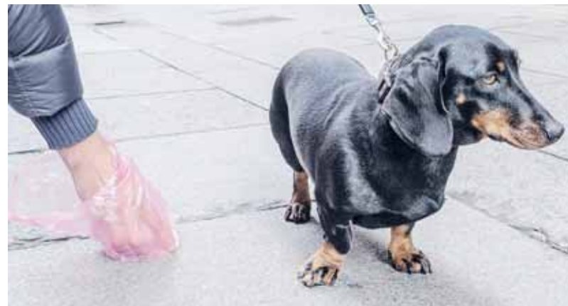
Recoger los excrementos es obligatorio en toda la ciudad.

Estos son sólo algunos de los cambios y modificaciones que se esperan para este año 2022. Sean cuales sean las medidas que lleguen a realizarse, lo esencial es que poco a poco se vayan consiguiendo avances en todos los aspectos relacionados con los animales de compañía, con el único objetivo e interés de mejorar y potenciar su bienestar.