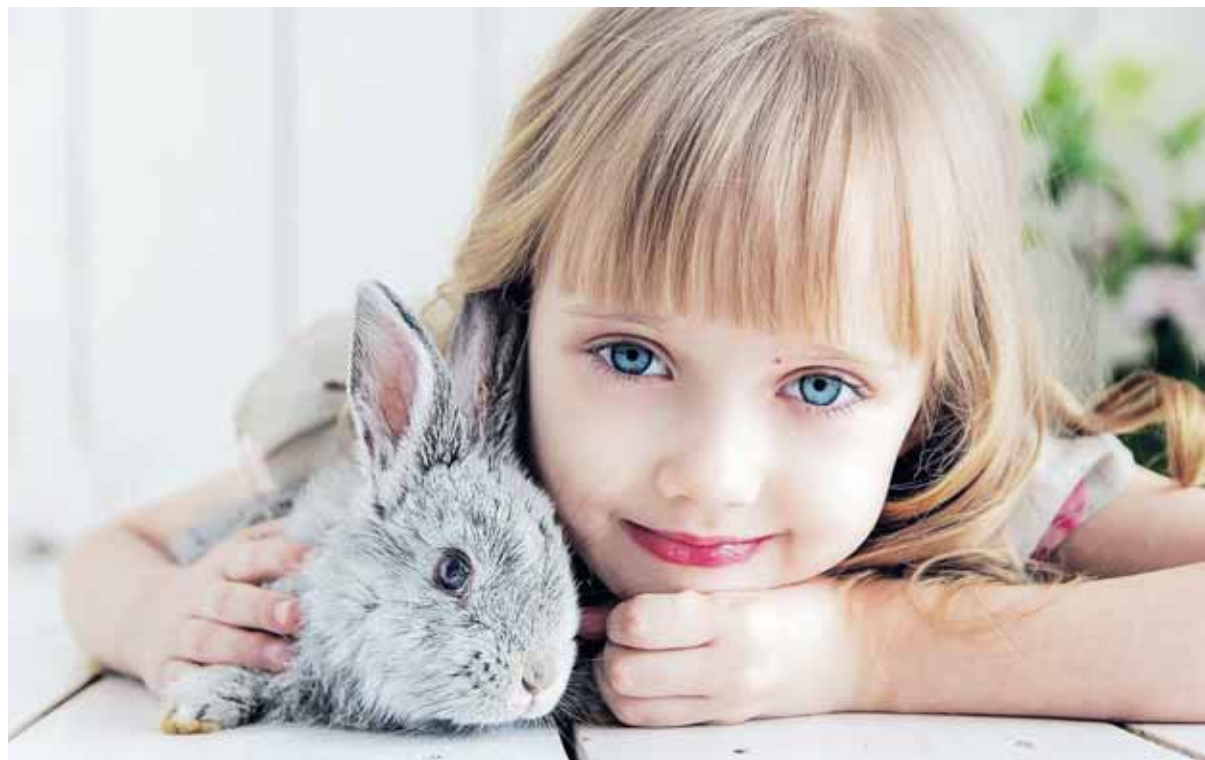
Convivir con animales desde pequeños fortalece el sistema inmunológico de los niños.

Los beneficios que los animales aportan a los humanos son innumerables. Compañía, alegría,