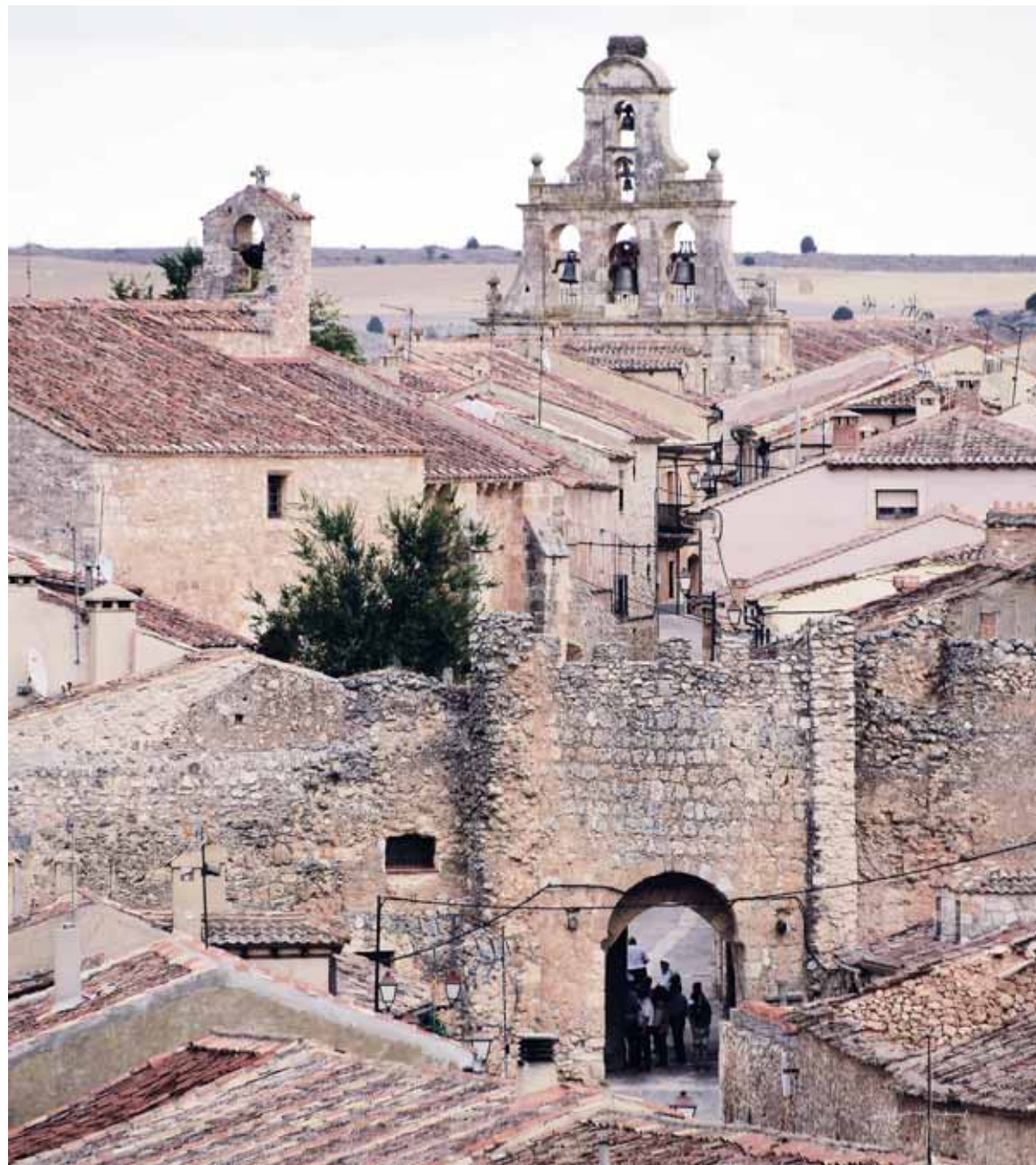
El 'Arco de la Villa', entrada emblemática a Maderuelo, y al fondo la majestuosa espadaña de la iglesia de estilo mudéjar de Santa María del Castillo.

La estructura de este pueblo es irregular, predominando las calles estrechas y alargadas, adosadas a la muralla.