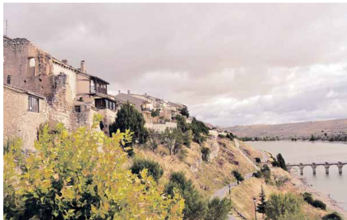
Desde los pies de la villa de Maderuelo hasta las Hoces del río Riaza comprende el embalse del Arroyo de Linares.

Según cuenta la tradición en una de estas sabinas centenarias se apareció la Virgen a unos pastores, conservándose dicho árbol en el centro del templo.