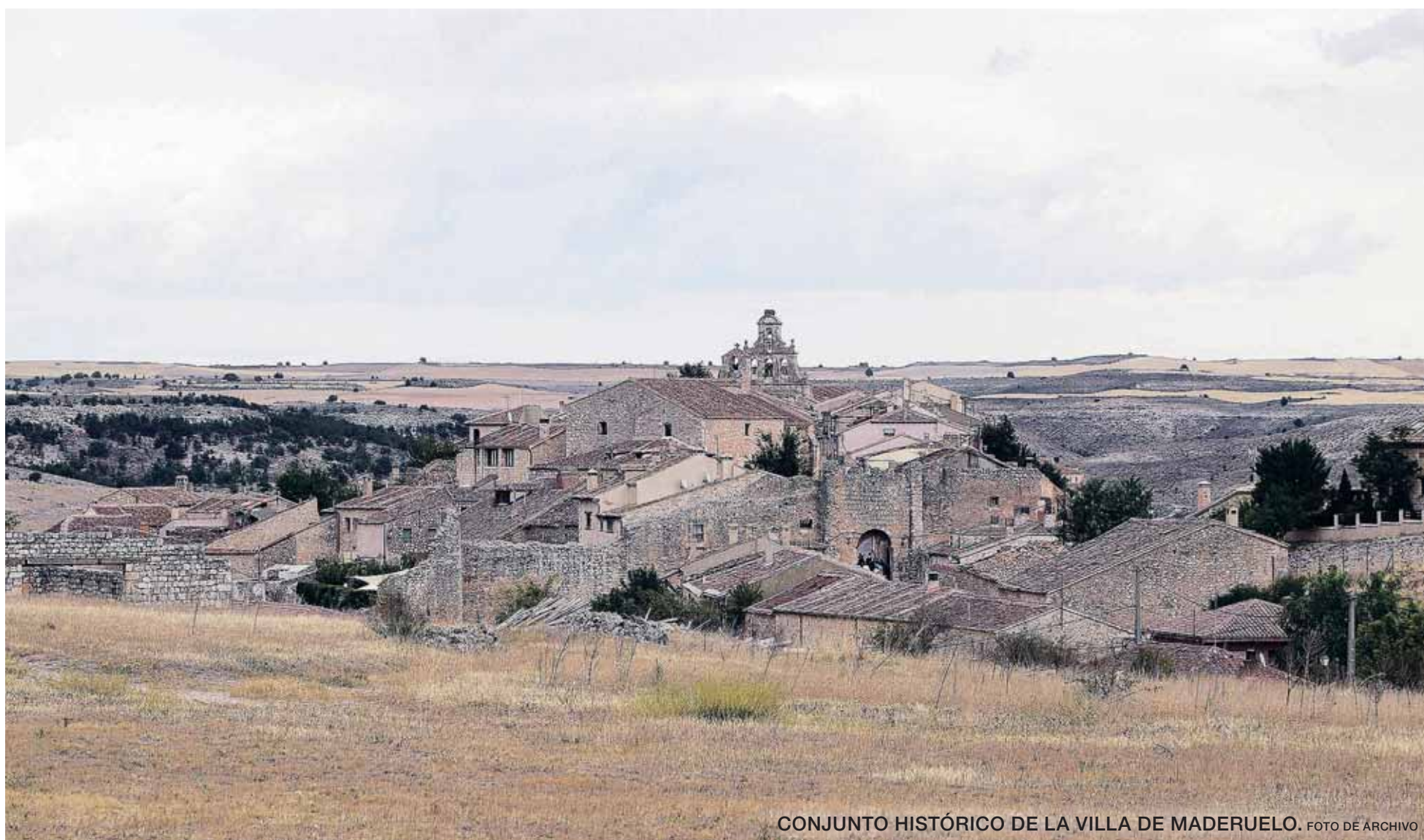
CONJUNTO HISTÓRICO DE LA VILLA DE MADERUELO. FOTO DE ARCHIVO