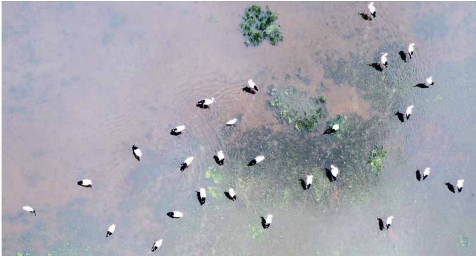
En la actualidad, la superficie recuperada del humedal es, aproximadamente, de veinticinco hectáreas.