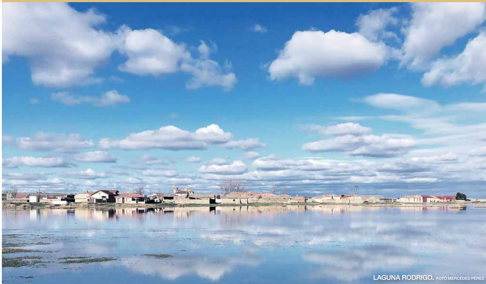
LAGUNA RODRIGO. FOTO MERCEDES PÉREZ