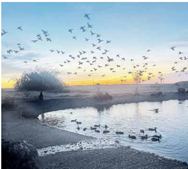
Cisnes blancos y negros; patos Mandarin, Carolina, Esmeralda o Mignon, Azulón y Gallineta común son algunas de la aves en estas lagunas.

animando y han ido comprando e incorporado una pareja de cisnes negros, —Cygnus Atratus—, otra