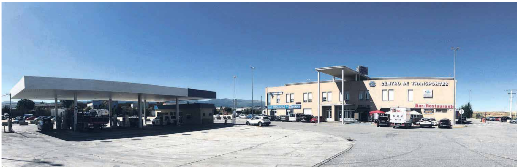
El objetivo principal de Semutransa es dar servicios auxiliares a los transportistas profesionales.